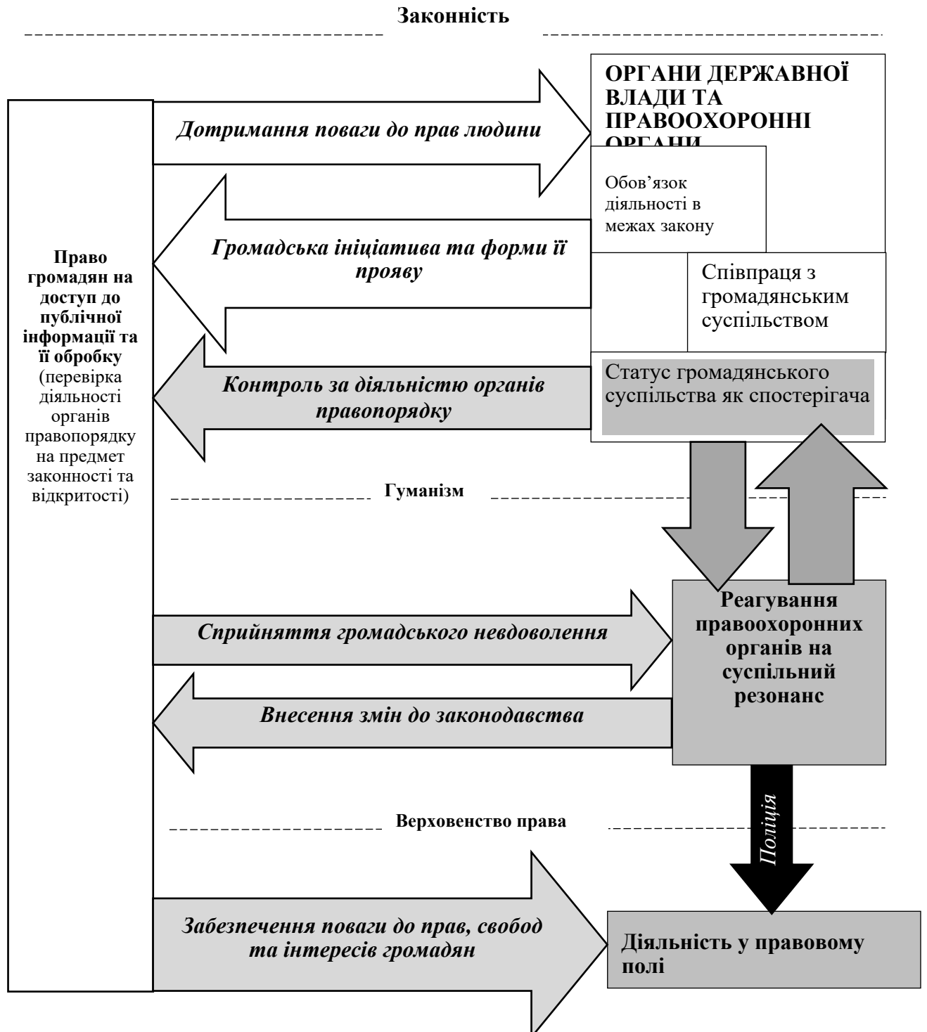
Рис. 1. Концептуальні засади громадянсько-правоохоронної комунікації в Європейському Союзі

Проведений комплексний аналіз змісту й організаційного забезпечення механізмів впливу громадянського суспільства на державне регулювання правоохоронної діяльності в країнах ЄС дав змогу надати авторську систематизацію концептуальних засад громадянсько-правоохоронної комунікації в Європейському Союзі, в основі якої зорієнтованість на культивування свободи слова та свободи думки, участь громадян у суспільно-політичному житті задля оперативного реагування на суспільні зміни та громадську активність (див. рис. 1).